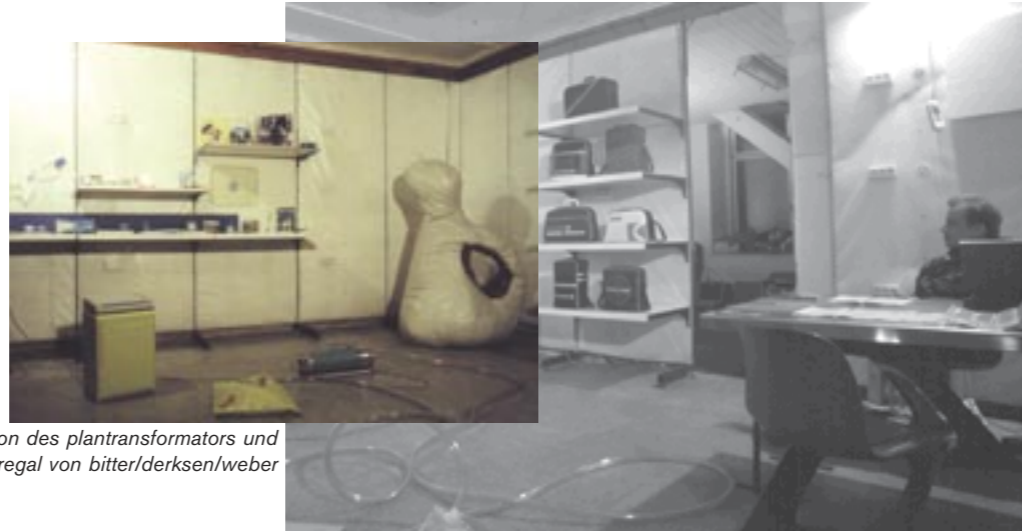
"perable" mit schlauchkonstruktion des plantransformators und "super stuff" im regal von bitter/derksen/weber