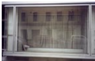
lokal schönbrunnerstrasse 88a, 1050 wien

die „storefront discussion“ als untertitel des gesamtprojektes "making-it" wurde durch die installation des „public paradormo“ auf andere themen gelenkt: die agentur konzentrierte sich auf aneignungsprozesse durch den konsu-